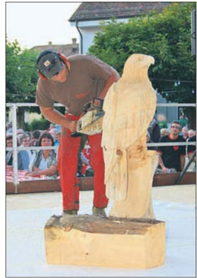
Mit viel Sorgfalt und Freude waren alle dabei, an der Bundesfeier auf dem Schmittiplatz. Die Hot-Dogs waren – vielleicht dank der fröhlichen Bedienung – schnell ausverkauft, für ein herrlich kleines aber feines Feuerwerk war gesorgt und auch der Adler fand ein heimatliches Nest.