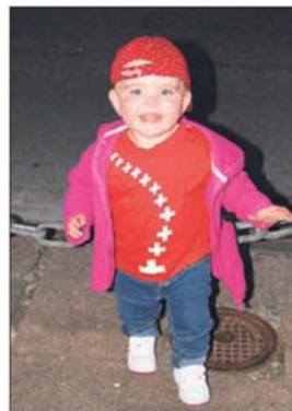
Würde ein 1.-August-Preis vergeben, der Kleine wär der Gewinner.